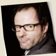
Vince Ebert Wissenschaftskabarettist